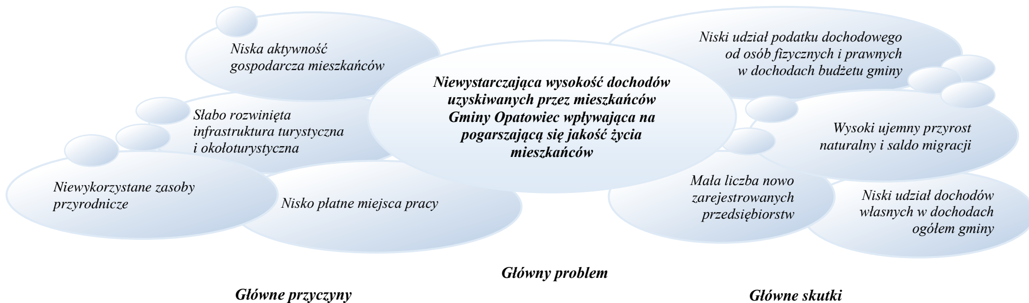
Rysunek 1 Drzewo problemów